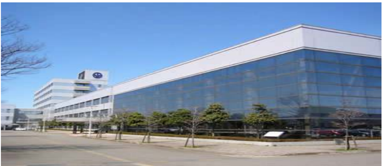
(福井県工業技術センター)