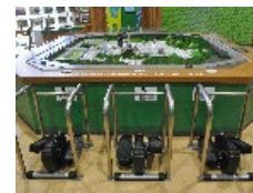
発電体験コーナー